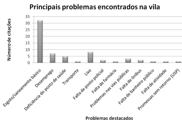
Figura 4: Principais problemas da vila apontados pelos entrevistados

As oficinas realizadas na vila foram de grande interesse aos participantes que, demonstraram estarem hávidos por aprender novos ofícios e que têm grande interesse na utilização desses ofícios como forma de enriquecimento da renda familiar (FIGURA 4).