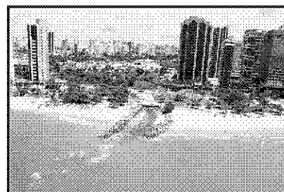
Foto Aérea revela um esgoto despejando resíduos a céu aberto na praia da Avenida Beira-Mar, onde está instalada boa parte dos melhores e maiores equipamentos de hotelaria, restaurantes e bares de Fortaleza